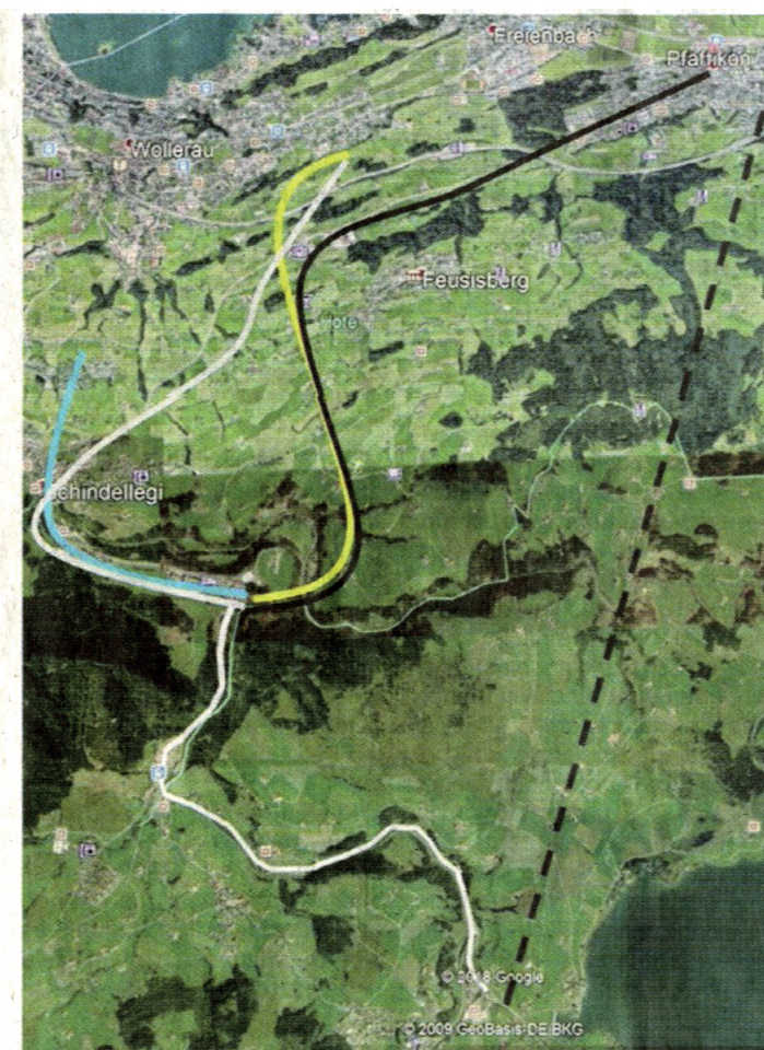
Die Varianten der Abwasserleitung von Einsiedeln zum Kanalnetz des Abwasserverbands Höfe: gelb die Variante Eulen, schwarz die Variante Pfäffikerstrasse, blau die Variante Wollerau, grau die Variante Schindellegi, schwarz gestrichelt die Variante Etzel. Realisiert werden soll die Variante grau durch Schindellegi bis in die Eulen in Wilen.

Aber vermag die ARA Höfe denn das zusätzliche Volumen und die Schmutzstofffracht aus Einsiedeln und dem Ybrig überhaupt